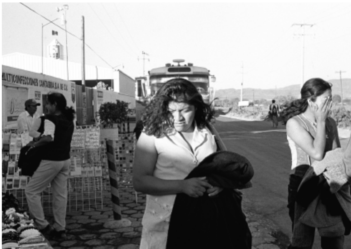
Hora de salida, Tehuacán, 2003.

estas personas se dio aún dentro de la planta” ( Norte , 8 febrero 1995).