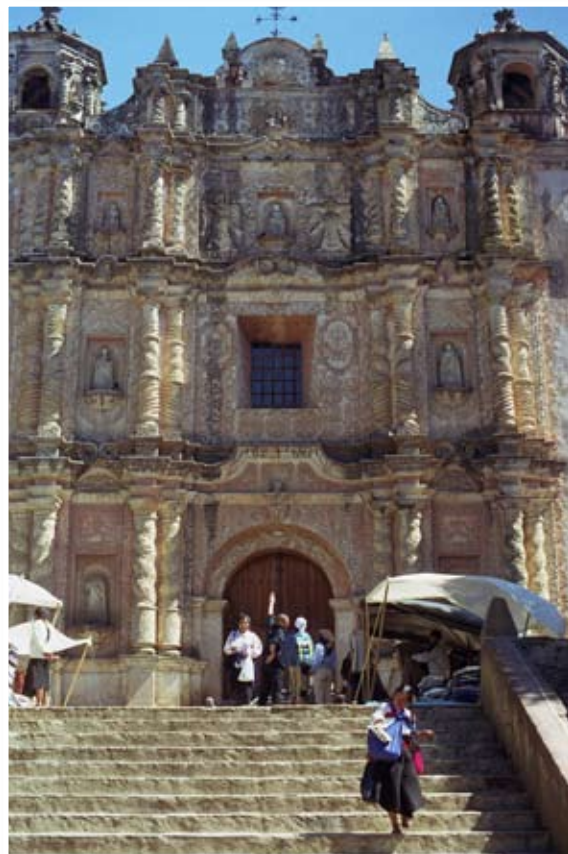
San Cristóbal de Las Casas, Chiapas, 2000.

Este enfoque no es nuevo, sin embargo, el carácter de cada región y de su población hizo que la misma institución funcionara y se desarrollara de forma diferente, por lo que esta