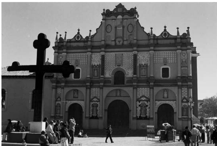
San Cristóbal de Las Casas, Chiapas, 2000.

El primer aspecto que destaca de las cofradías es su carácter colectivo y organizativo; desde sus orígenes tuvo como funciones más importantes la fraternidad, solidaridad y ayuda mutua entre los miembros del grupo social en donde se fundaba. Además, tenía un claro carácter religioso, relacionado con la celebración de la festividad de los santos patronos, la veneración y el culto a diferentes advocaciones y misterios del catolicismo, el fomento de la religiosidad popular. Esto último es lo que resalta en las cofradías de indios de este estudio. Observamos a las cofradías en el contexto de las transformaciones religiosas asociadas a la evangelización y el nacimiento de una nueva religión entre los pueblos nativos. El desarrollo de las características de esta nueva religión, que tuvo varias fases –Ruz las llama total erradicación, conjunción, inversión del orden –, estuvo marcado por el intento inicial de destrucción del mundo religioso autóctono, considerado como diabólico e idolátrico y la imposición de un nuevo sistema religioso. Pero a lo largo del camino, se fueron desarrollando varios procesos que determinaron las características de la religión sincrética, resultado de éstos me refiero a los que contempla Marzal en su teoría sobre el sincretismo: persistencia, pérdida, síntesis y reinterpretación. También